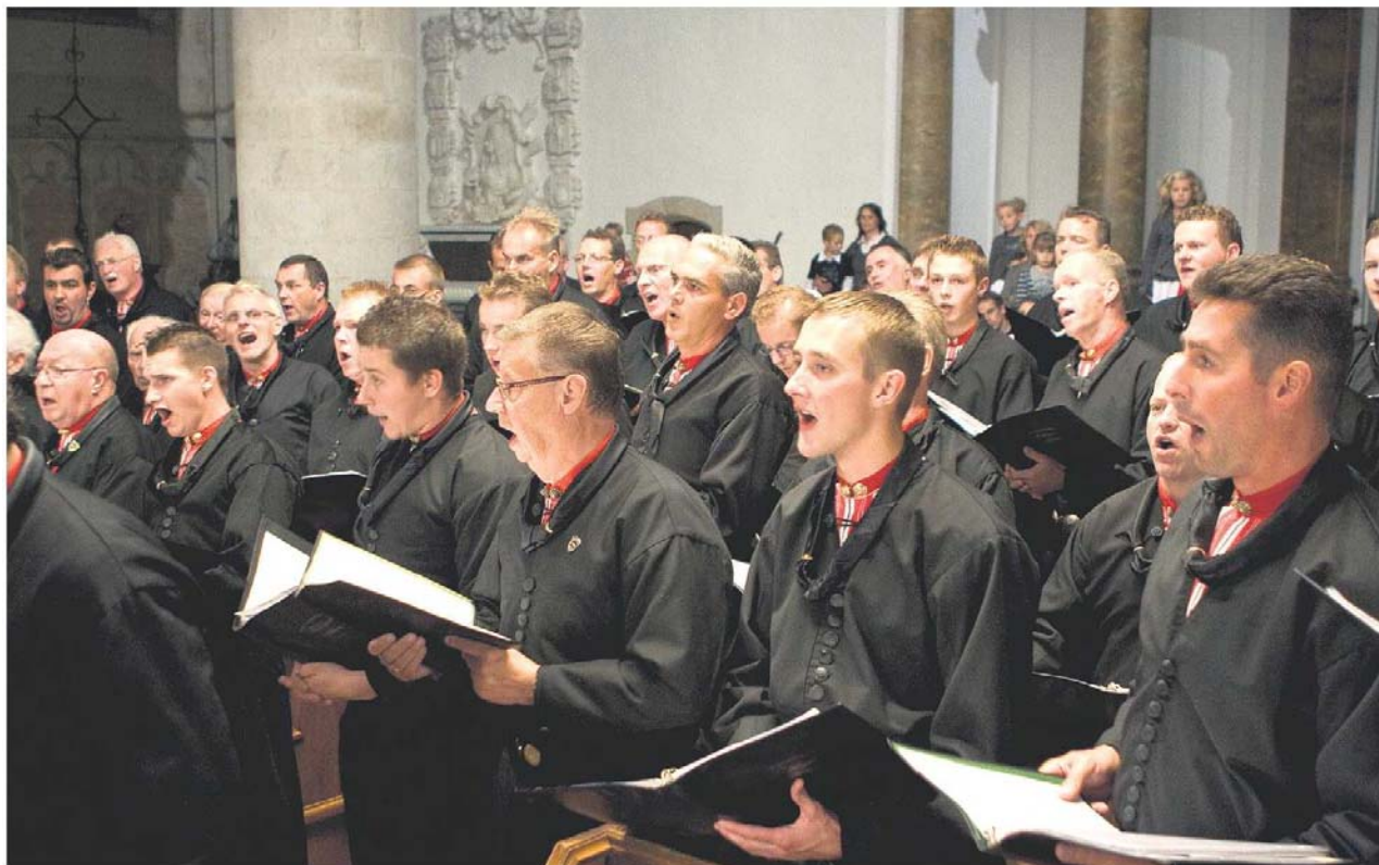
Het Urker mannenkoor Hallelujah viert dit jaar dat het honderd jaar bestaat.